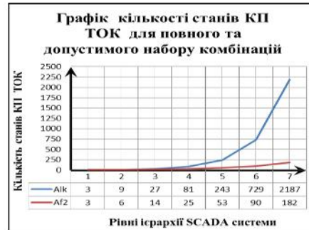
Рис. 2.2. Графіки динаміки зміни кількості станів КП ТОК