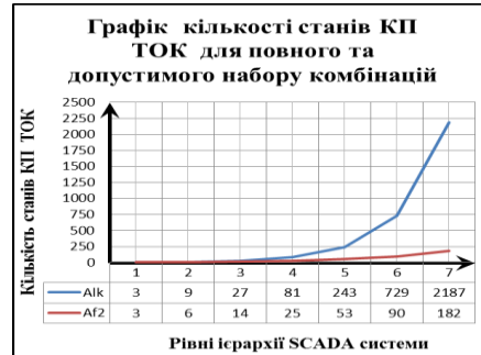
Рис. 2.2. Графіки динаміки зміни кількості станів КП ТОК